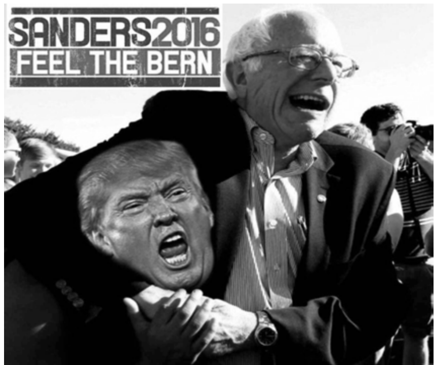
Sanders en Trump: vrijhandel is nachtmerrie

de top 100 47 multinationale ondernemingen zijn. 70% van de handel wordt gecontroleerd door 500 bedrijven. Toch stellen de machtige bedrijven wereldwijd slechts 73 miljoen mensen te werk wat goed is voor 2 à 3% van de totale tewerkstelling. We gaan ervan uit dat rijkdom in een samenleving steunt op de menselijke arbeid en niet op 'vrijhandel'. Samen met de Franse Prof. Daniel Cohen zijn we het eens waar hij in zijn boek "De mondialisering en zijn tegenstanders" (2005) schrijft: "Het is onbegrijpelijk waarom de mondialisering de mensen zo bezighoudt. Terwijl uit de statistieken blijkt hoe klein het belang ervan is voor de werkgelegenheid. Enkele getallen illustreren het verbazingwekkende contrast tussen handelscijfers en werkgelegenheidsopbouw. De handel draait voor 80% op industriële en agrarische producten en slechts voor 20% op dienstverlening. De realiteit betreffende de werkgelegenheid in de rijke landen is een volledig tegengestelde situatie. De werkgele-