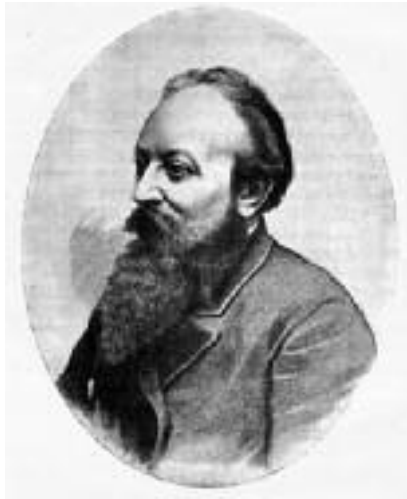
César De Paepe : socialisten van het eerste uur snel in vergetelheid