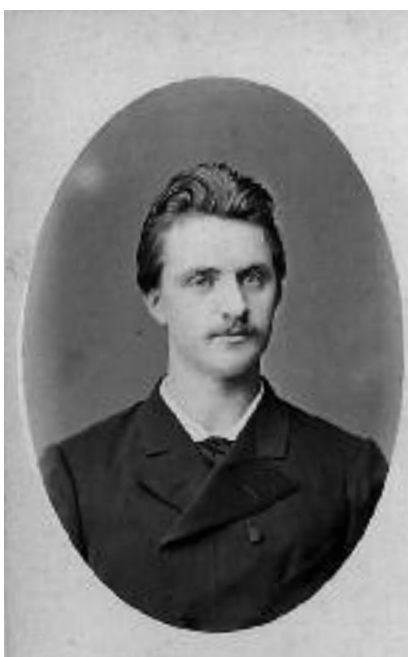
Jozef Haller von Ziegesar

Legerwet: stemming 2 juli 1913 en publicatie 31 juli 1913; het territorialiteitsprincipe (Vlaams en Waalse regimenten) sneuvelt ten voordele van het tweetaligheidsprincipe met het Frans als enige commandotaal. Schoolwet: stemming 21 januari 1914 en publicatie mei 1914; ook hier kan het territorialiteitsprincipe niet worden doorgedrukt en dit ten voordele van een kreupel tweetalig stelsel en het (in)fameuze principe van de liberté du père de famille . Bovendien werd de vernederlandsing van U-Gent in maart 1914 wel gestemd maar het bleef wachten op uitvoeringsbesluiten.