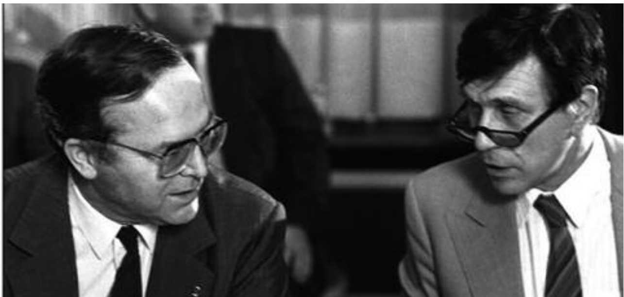
Martens en Schiltz : aan gematigde krachten zou Vlaanderen alles te danken hebben

Het valt niet te ontkennen dat er binnen het Vlaams-nationalisme een soort schaamte bestaat, die bijvoorbeeld tijdens het interbellum ook al bestond, t.o.v. het activisme. Alleen al de directe connotatie met het Duitse Militär is blijkbaar nog steeds onoverkomelijk. Maar was bijvoorbeeld het Britse militarisme niet vergelijkbaar met het Duitse? Lees er de biografie van Horatio Kitchener eens op na en je waant je bij 'der grosse Fritz' van Pruisen. Zijn opvoeders (in West-Ierland) lieten hem bijvoorbeeld urenlang vastgebonden tussen twee bomen in de vrije natuur staan, gewoon om hem te 'harden'. Ook het Britse superioriteitsgevoel uit die dagen moet zeker niet onderdoen voor het Duitse. Bovendien interfereerden de Duitsers ook op andere plaatsen dan Vlaanderen. Wie verwijt er de Duitse betrokkenheid bij de onafhankelijkheid van Ierland? Of de essentiële Duitse betrokkenheid in het slagen van de Russische Oktoberrevolutie? Bovendien kun je als natie je vijand maar (politiek) laten scoren als je hem hier-