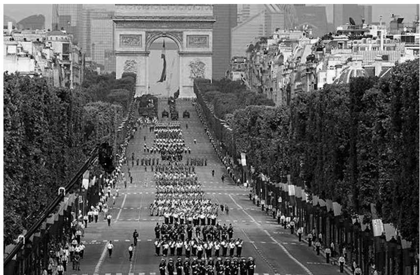
Militaristisch vertoon op Wapenstilstand

De weerzin waarmee de Europese lidstaten de billen dichtknijpen voor Carles Puigdemont heeft niet zozeer vandoen met grondwettelijkheid of fout bestuur in Catalonië, maar vooral met zijn methode. De nationalisten hebben zich nauwelijks tot niet laten verleiden tot het gebruik van geweld, de Guardia Civil des te meer. Alsof Tejero nooit verdwenen is. Elk centralistisch bestuur is monomaan, en zoekt absolute machtsuitoefening, Spanje is daar een mensonterend voorbeeld van. Daartegenover staat het getuigenis van Puidgemont, die misschien niet de meest onderlegde strateeg of de moedigste politicus is, maar op wiens uitgangspunten weinig valt af te dingen. Dat hij de vriendschappelijke scheiding tussen Tsjechië en Slovakije als