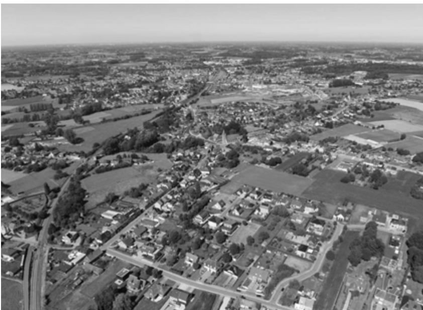
Snippertjes groen in het Vlaamse verkavelingslandschap

als overbevissing; houtkap; stroperij van wilde dieren; illegale mijnbouw; klimaatopwarming; vervuiling met als meest spectaculaire de plasticafval in de oceanen die sinds 1980 vertienvoudigd is. Sommige vissen en zeezoogdieren sterven met hun maag vol plastic (recent spoelde een dode walvis aan in de Filippijnen met in zijn maag 40 kg plastic, in Sardinië was het een zwangere walvis met 22 kg afval). In Canadese poolgebieden werd door wetenschappers in de dooiers van eieren van stormvogels sporen van plastic gevonden. Voor hen was dit schokkend, omdat dit het bewijs is dat onzichtbare plastic via de moeder bij het jong belandt. Eric Stienen, coördinator Zeevogelteam bij het Instituut voor Natuur- en Bosonderzoek (INBO) stelt dat in 90 procent van de stormvogels die het Zeevogeltam onderzoekt plastic zit. De landen rond de Noordzee hebben afgesproken om te proberen dat cijfer terug te brengen naar minder dan één op tien. Maar dan zal er nog veel (proper) water naar de zee moeten vloeien, zegt de coördinator.