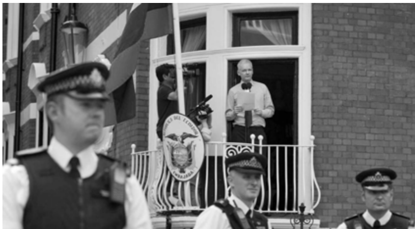
Assange spreekt pers toe vanop balkon Ecuadoraanse ambassade in Londen

Met de huidige partijen en een overwegend conservatieve Vlaamse bevolking, wordt Vlaanderen stilaan één onleefbare mierenhoop. "We zijn een hardwerkende regio. Als de Vlamingen groen, bossen en water willen, kunnen ze op vakantie naar de rest van Europa waar nog veel zon, zee, bergen en bossen zijn" , orakelde ooit cynisch een kopstuk van de liberale partij. Vandaag zegt een kopstuk van de Open VLD, Bart Tommelein, dat het onhaalbaar is om het ruimtebeslag tegen 2025 van gemiddeld 6 hectaren per dag, te