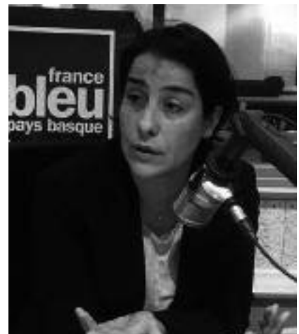
Senator Frédérique Espagnac

Het is de Franse senatrice Frédérique Espagnac uit het departement Pyrénées Atlantiques die zich als bemiddelaarster opwierp en de zaak van de ETA-ontwapening tot op het hoogste niveau van de Franse politiek aankaartte. Tot dan toe had de Franse staat de Spaanse desiderata met betrekking tot de strijd tegen ETA op de voet gevolgd, daar het ETA-geweld als een 'buitenlands' probleem werd beschouwd. Maar de zaak-Luhuso bracht toch een kentering omdat de Franse overheid zich bewust werd van het feit dat de wapens zich tenslotte op haar grondgebied bevonden, dat ze een gevaar voor de bevolking uitmaakten én dat de samenleving in Frans-Baskenland zich ook zeer betrokken toonde bij dit probleem. Ook de lokale politieke autoriteiten en niet in het minst de prefect van Pyrénées Atlantiques die ook nog eens adjunct-kabinetschef was geweest van de Franse eerste minister Bernard Cazeneuve , stelden alles in het werk om door te dringen tot president François Hollande . Op radio