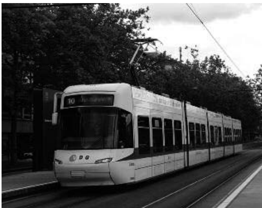
Zürich : puike stadsplanning

(1)De Decker haalt die argumenten aan in zijn boek: '(1) de kansen op sociale mobiliteit stijgen door diversere en betere netwerken; (2) middenklassers gelden als (normerend) rolmodel voor armere bewoners; (3) ruimtelijke nabijheid van diverse culturen leidt tot meer wederzijds begrip en respect; (4) in te arme wijken vertrekken ook economische actoren zoals winkels en diensten en ontstaat een negatieve spiraal; (5) sociale mix kan de stigmatisering van bepaalde buurten tegen gaan, wat immers een stigmatisering is van de bewoners van deze buurten als zij elders bv werk zoeken. ( De geest van suburbia , blz. 326-327).