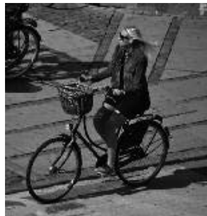
Blond meisje op de fiets in Deense hoofdstad

Het is een boeiend en moeilijk debat. Als je de markt laat werken heb je sowieso segregatie. De voorstanders van sociale mix viseren daarmee enkele doelstellingen, (1) waarvan evenwel nog nooit bewezen is dat we die halen via een beleid van sociale mix. Ik denk dat diversiteit wel werkt, maar enkel als er echte mix is in goede verhoudingen, en geen dominantie van bv 90% Italianen, Turken, Mrok-kanen, Japanners ... want dat leidt tot taalkundige dominantie en gebrek aan communicatie. Ghetto's ontstaan vrij spontaan – door volgmigratie, door eigen verenigingen, eigen winkels - ... en finaal men heeft ook de nood niet meer om de taal van het land te leren want men beredert zich met de eigen