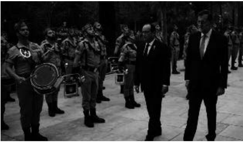
Rajoy en Hollande tijdens Frans-Spaanse top in Málaga

France Bleue – Pays Basque verklaarde Espagnac naderhand dat op die manier een koerswijziging werd doorgevoerd. Het hielp ook wel dat Manuel Valls zijn ontslag had gegeven als premier om zich beschikbaar te stellen voor de voorverkiezingen met het oog op de Franse presidentsverkiezingen. Valls stond bekend vanwege zijn harde lijn en zijn onvermuisbaarheid ten aanzien van ook maar enige vorm van een 'onderhandelde' oplossing voor het Baskische probleem. Toen Frankrijk eenmaal de steven had gewend, heeft president Hollande, bij gelegenheid van een Frans-Spaanse top in Málaga, de Spaanse premier Mariano Rajoy persoonlijk op de hoogte gesteld dat Frankrijk voornemens was het groene licht te geven aan een wettelijk omkaderde wapenoverdracht. De Spanjaard kon niet veel meer doen dan hier acte van nemen.