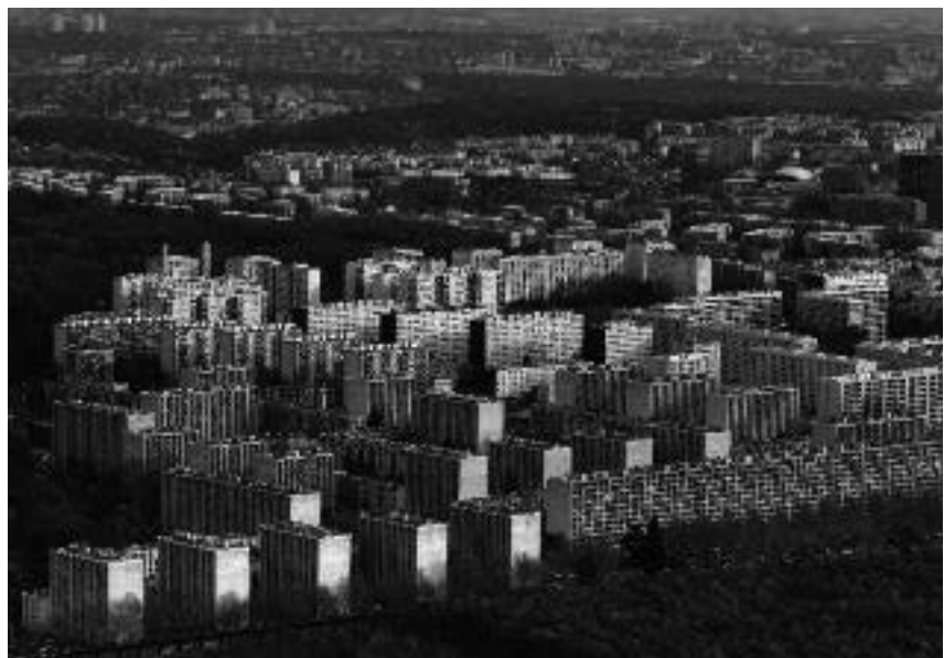
HLM ten westen van Parijs

Ja, maar de armoede in de stad heeft te maken met de krotten en ondermaatse woningen die er blijven staan, daarbuiten is de stad altijd duurder geweest dan het platteland. Maar het is paradoxaal: de mensen met de laagste inkomens wonen op de duurere gronden.