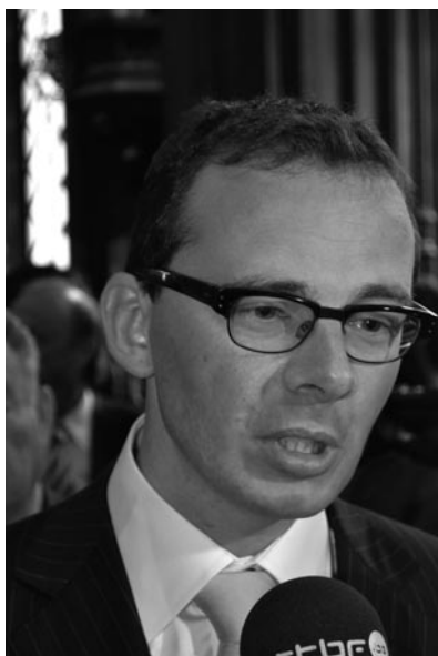
Wouter Beke maakt er een potje van.

En dan is er nog Wouter Beke . De minister die een blunderboek opstapelt dat dubbel zo dik wordt als dat van de hele regering Michel-Jambon-Wilmès-Geens . Voor hem geldt wat voor Filip de Belgique geldt: hij kan het niet. En hij wijt dat aan iedereen. Zijn welzijnskabinet is nog onvoldoende ingewerkt. Arme Jo Van Deurzen , kop van jut. Hij heeft wel voor mondkmaskers gezorgd. Behalve dat ze niet werken of niet geleverd zijn. Of moeten betaald worden zoals vaccins die niet dienstig blijken. Arme Philippe De Backer , ook al kop van jut. Hij heeft niks verkeerd gedaan met de zorgcentra. Ik durf het niet te vragen aan mijn bejaarde moeder, als ze me hologisch aankijkt en fluistert, ik zit hier in een echte gevangenis. Arme Maggie De Block , kop van jut. Zijn partij begrijpt hem niet. Arme Joa-chim Coens , kop van jut. Contactonder-