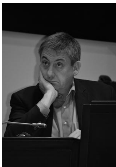
Ook 'sterke Jan' wil 'sterke staat'

het recht op leven heilig is, dan moet het wel wáárdig leven zijn, geen slavenstaat of proefkonijn voor ziekenhuistechnologie. En als er één recht is dat boven de staat gaat, dan is het het recht op vrijheid. Vrijheid en Gelijkheid. De overheid, de politieke en zeker de economische kaste heeft níét het recht in Poupehan of Davos of in duistere achterkamertjes beslissingen uit te vaardigen zonder inzage