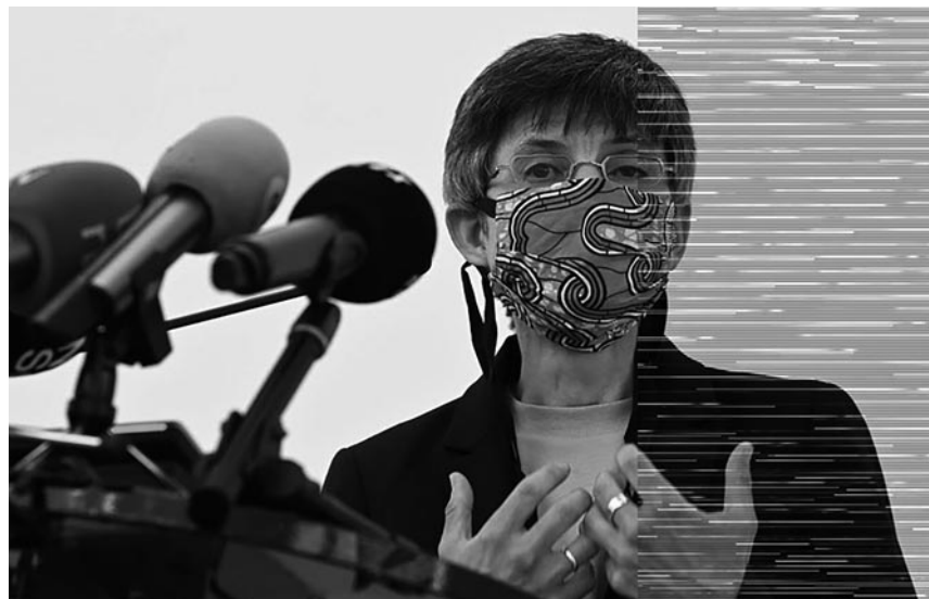
Gouverneur van Antwerpen vaardigt avondklok uit

De burger heeft het maar al te goed begrepen. Hij en zij beseffen zeer goed welke gevolgen een Woehanaandoening uitlokt, hij en zij nemen meer voorzorgen dan nodig – maar het enige antwoord dat de overheid geeft is straffen en repressie. De hooghartigheid uit zich in neerbuijgendheid: het volk begrijpt ons niet, en het is er nochtans voor ons. Het is die