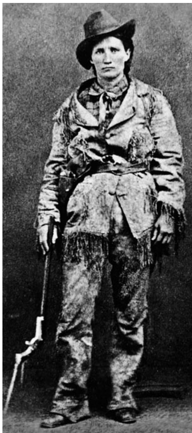
Calamity Jane (1852- 1903)