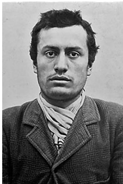
Benito Mussolini, directeur van ‘Avanti’